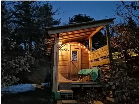
sauna tonneau de 10 pl., au feu de bois et eau de source