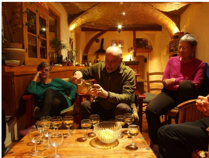
Notre gîte : une salle voûtée de 65 m2 unique dans les Hautes-Alpes