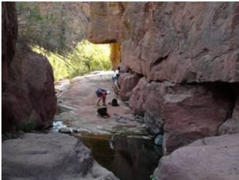
Couleurs et textures chaudes de la roche volcanique de Gran Canaria