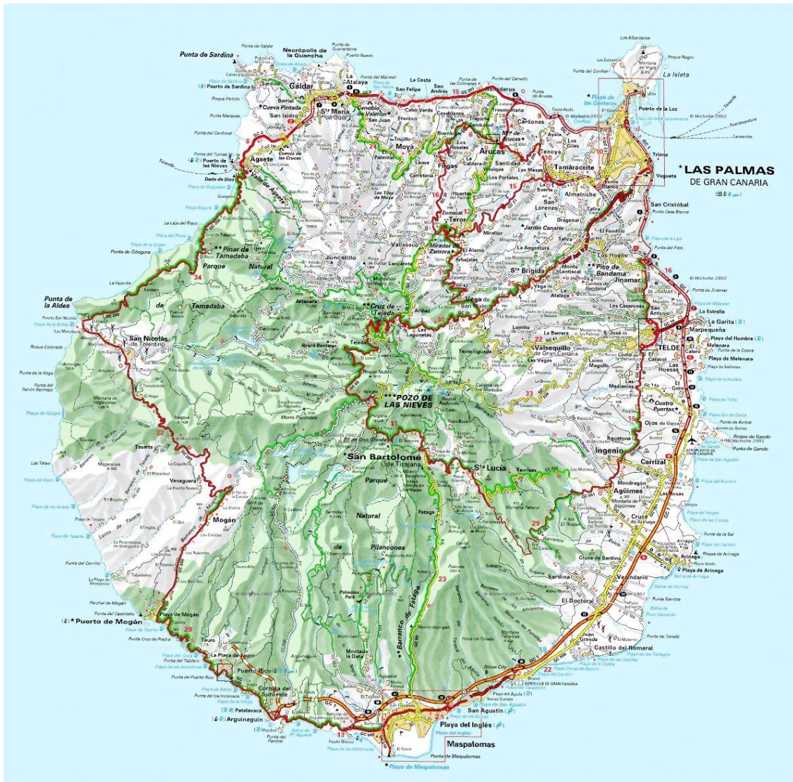
Carte générale de Gran Canaria