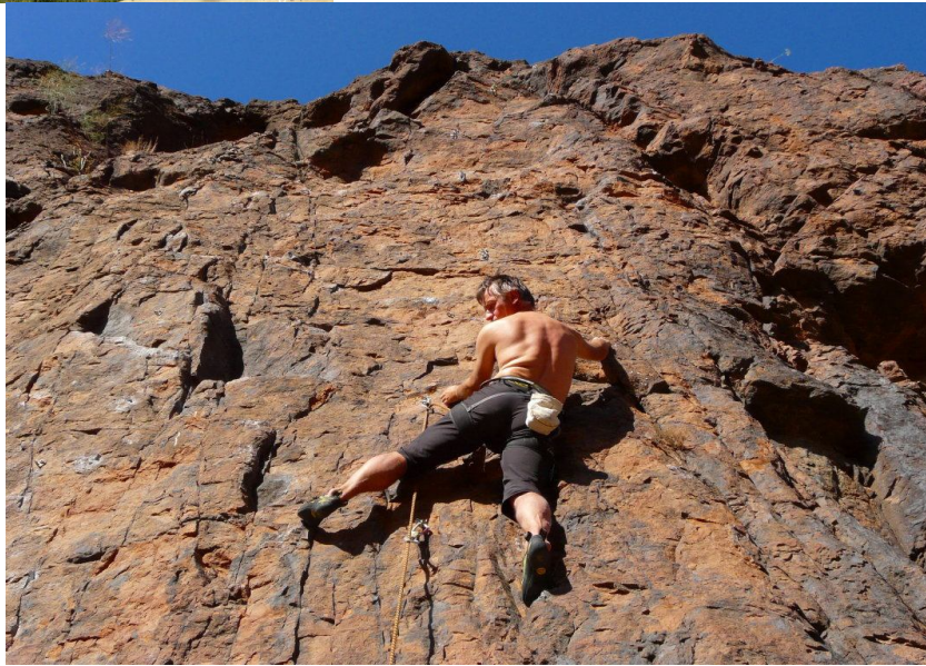
La belle falaise variée de Fataga