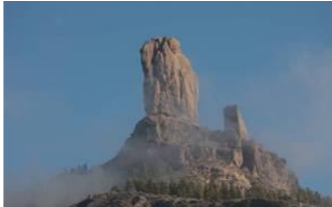
Roque Nublo, 2 ème sommet de l'île et point de vue admirable !