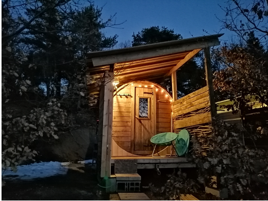
sauna tonneau de 10 pl., au feu de bois et eau de source